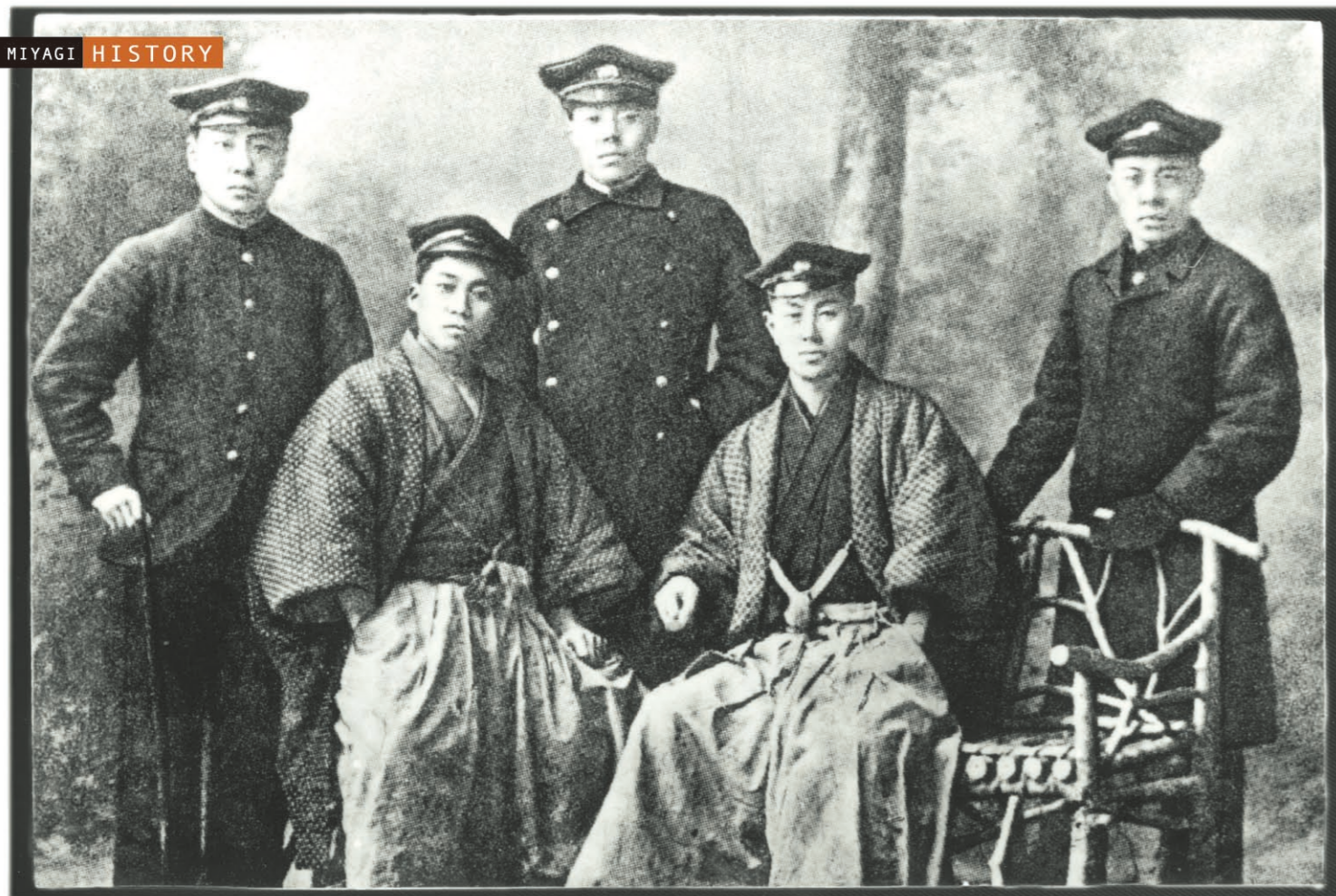
摄于1906年3月,左第一人为鲁迅,即将离开仙台时与同班同学的合影。