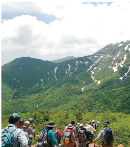
徒步旅行 宫城县有藏王、栗驹山等众多著名的登山游览胜地。