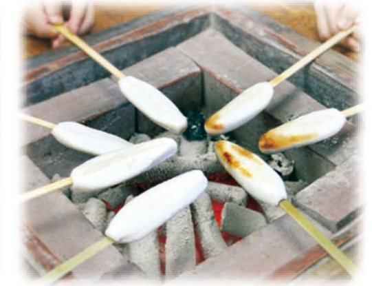
手工竹叶鱼糕制作体验 (仙台市·盐釜市·松岛町·女川町)