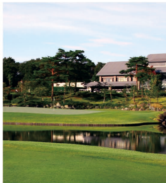
高尔夫球 宫城县有多个高尔夫球场, 可以在各地享受舒适的高尔夫乐趣。