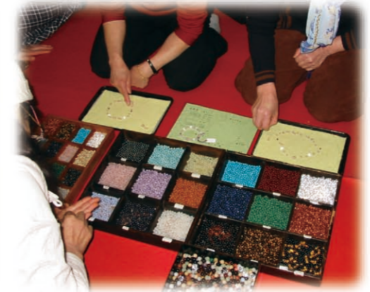
数珠制作体验 (松岛町)