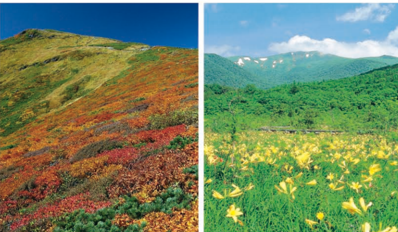
栗驹山，世界谷地(栗原市) [P01-C] 栗驹山的南山麓覆盖着密密的山毛榉林，与尾濑、八幡平并列日本有数的湿原野。5月上旬，水芭蕉开花，到了夏天，又是日光黄菅遍满山麓。从仙台市中心乘车2个小时。