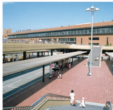
JR仙台站 仙台站是连接县内各地乃至链接全国的交通枢纽。地处仙台市中心,是新干线、在来线、高速巴士以及各种交通机构的出发停靠的中心。

拥有“森林之城”的美誉, 人口约100万人的仙台市是宫城县的中心, 也是东北地区重要的政治、经济中枢都市。 摩天大厦,百货店,写字楼等新建筑和商店陆续落成, 雅致的街景,洗练的都市氛围,令人留恋。 向您介绍潇洒的仙台都市风情。