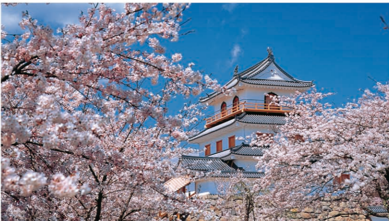
白石城的樱花(白石市) [P01-D] 仙台藩祖伊达政宗亲信“片仓小十郎”的居住地白石城是一个富有历史情感的城邑。春天也是著名的赏樱胜地。从JR仙台站乘坐东北本线电车约50分钟，于白石站下车徒步10分钟。