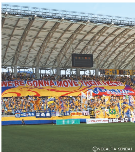
YURTEC室外运动场 [P08-D] “VEGALTA仙台”职业足球队大本营 (仙台市)

○滑雪场请参看第13页地图。 ○高尔夫球场的详细情况, 请向网页上的宫城县大连事务所或宫城县经济商工观光部观光课询问。