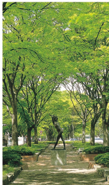
定禅寺街 夏天的“七夕祭”,冬天的“仙台光的盛典”,仙台的四季把榉树成荫的定禅寺街装饰得无比迷人。从JR仙台站徒步约15分钟。