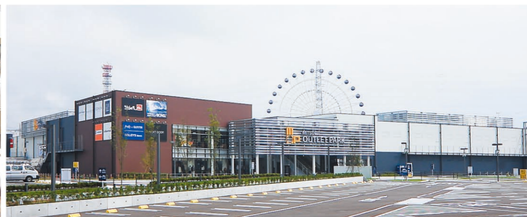
三井奥特莱斯仙台港

仙台有多种多样的商店, 从电脑到日用杂货, 应有尽有。您能买到物美价廉商品, 享受到大城市独有的购物快乐。除此之外, 宫城县还有很多接触日本传统文化等各种不同的旅游体验内容。详细请参考 http://www.miyagitheme.jp/ch/index.html