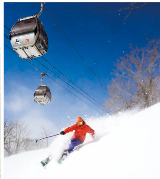
滑雪 境内有数十个滑雪场, 具有东北特有的优质雪质, 让您充分享受滑雪的乐趣。