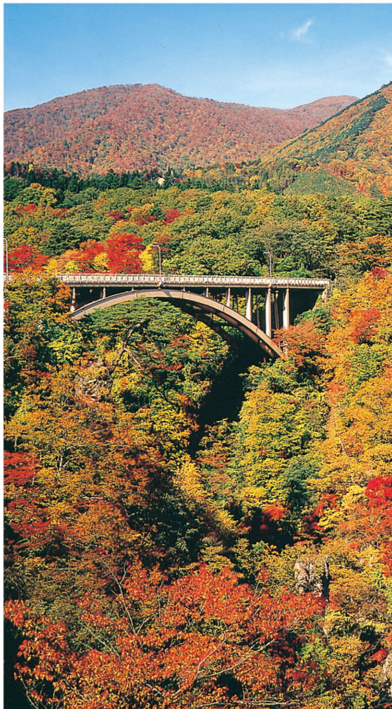
鸣子峡(大崎市) [P02-A] 沿着大谷川有全长约2.5公里，深100米的大峡谷，这里是闻名的红叶观光胜地。每到秋季，整个峡谷的断崖绝壁尽染红艳，精彩之至。沿河还有散步道，散步所需时间约一个小时。