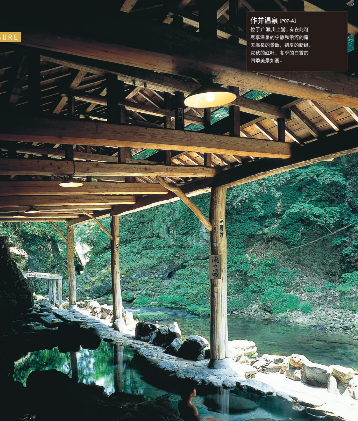
作并温泉 [P07-A] 位于广濑川上游, 有在此可尽享温泉的宁静和沿河的露天温泉的景致, 初夏的新绿, 深秋的红叶, 冬季的白雪的四季美景如画。