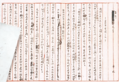
回忆仙台时代生活的段落,写于1926年,引自《朝花夕拾》。