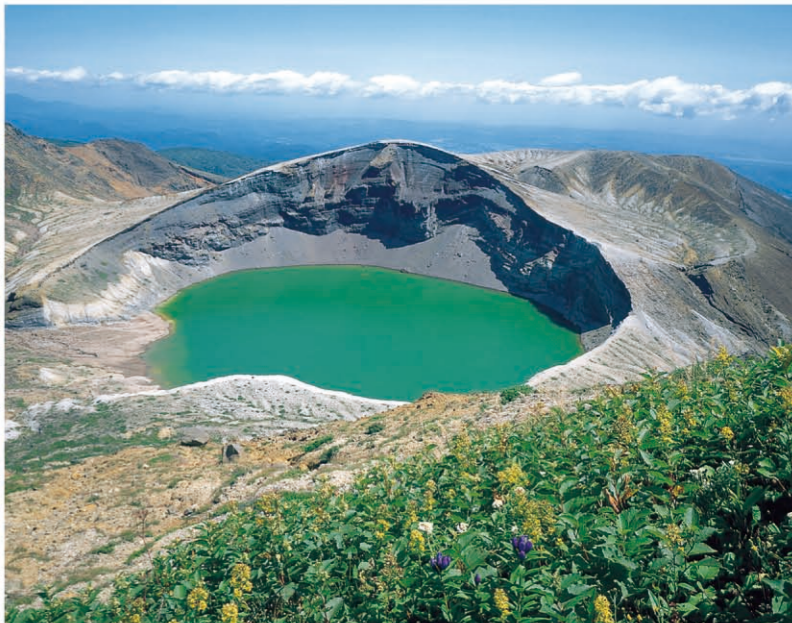
御釜 [P02-C] 横跨宫城和山形的山脉通称为“藏王”山脉，位于宫城县境内的火山口湖被称之为“御釜”。每天，钴色湖水的色泽随着光线的移动变换多端，神秘莫测。从仙台站乘车约60分钟。