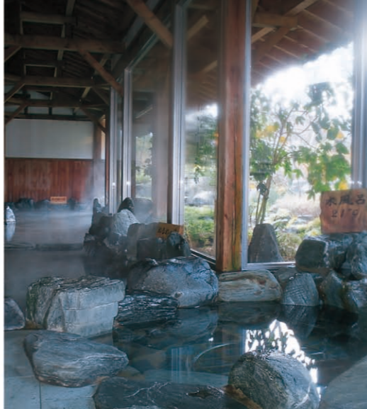
秋保温泉(仙台市) [P08-A] 日本“三大名汤”之一, 自古以来被作为保养地被人们所喜爱。从仙台中心部乘公交车约30分钟。