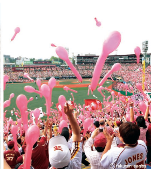
宫城乐天棒球场 [P08-E] “乐天EAGLES”职业棒球队大本营 (仙台市)