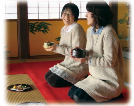
观澜亭抹茶体验 (松岛町)

仙台有多种多样的商店, 从电脑到日用杂货, 应有尽有。您能买到物美价廉商品, 享受到大城市独有的购物快乐。除此之外, 宫城县还有很多接触日本传统文化等各种不同的旅游体验内容。详细请参考 http://www.miyagitheme.jp/ch/index.html