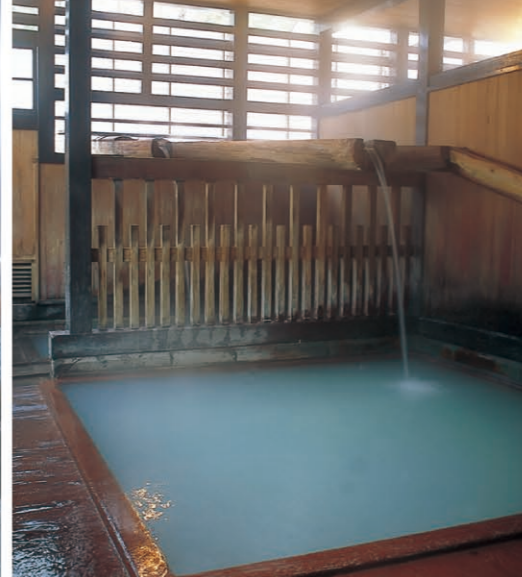
鸣子温泉乡(大崎市) [P08-B] 具有日本温泉11种成分中的9种, 有“黑泉”和“绿汤泉”等少见的温泉。从JR仙台站乘新干线约15分钟, 再换乘在来线约50分钟。