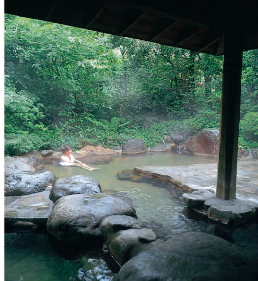
远刈田温泉(藏王町) [P08-C] “日本温泉百选”之一的名汤。从仙台市中心乘车约70分钟。