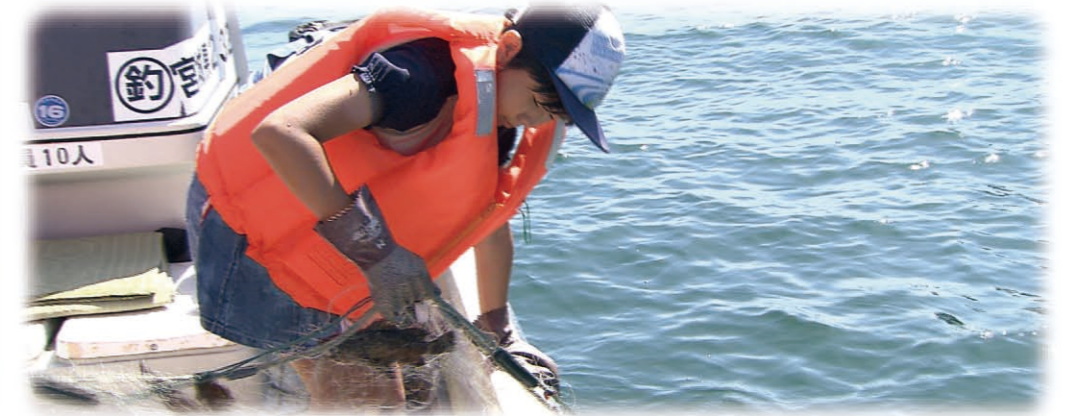
捕鱼体验 (东松岛市)