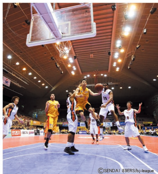
仙台市体育馆 [P08-F] “仙台89ERS”职业篮球队大本营 (仙台市)