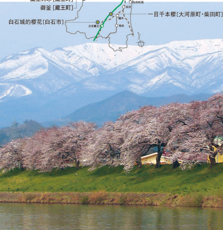
一目千本樱(大河原町·柴田町) [P01-A] 白石川的堤岸有约7公里长的樱花街道树，在樱花盛开的季节，那淡粉色的回廊，极具魅力，吸引了来自各地的观花游客。残雪的藏王连峰和一目千本樱的风景，美妙如画，是宫城著名的樱花名景。从JR仙台站乘坐东北本线电车约35分钟，于大河原站或船冈站下车徒步3分钟。