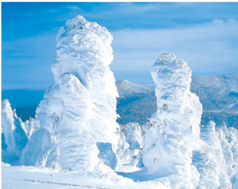
藏王树冰(藏王町) [P02-B] 树冰是水滴挂在树枝上结冰而形成的。在银色世界绝妙的树冰林立，正是气温、湿度、风等自然条件兼具而再现的大自然精彩艺术作品。宫城藏王在世界也是著名的树冰景观之地。