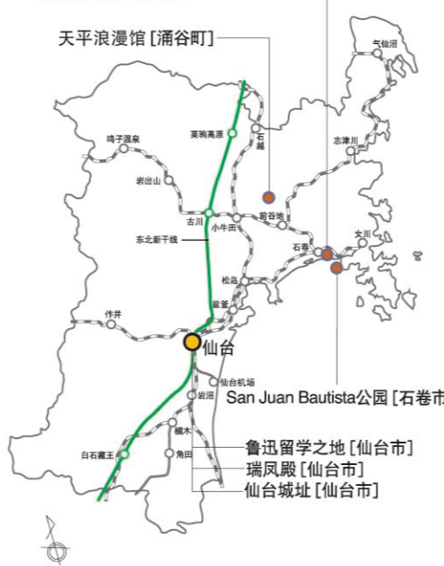
仙台 仙台机场 仙台城址(仙台市) 瑞凤殿(仙台市) 鲁迅留学之地(仙台市) San Juan Bautista公园(石卷市)