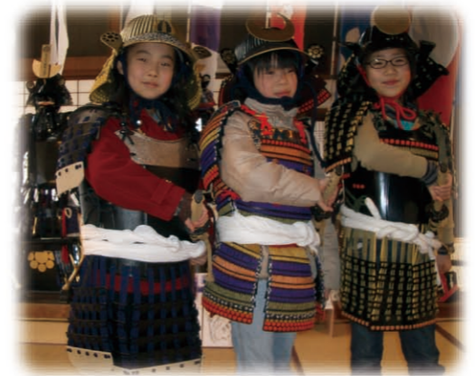
盔甲试穿体验 (白石市)