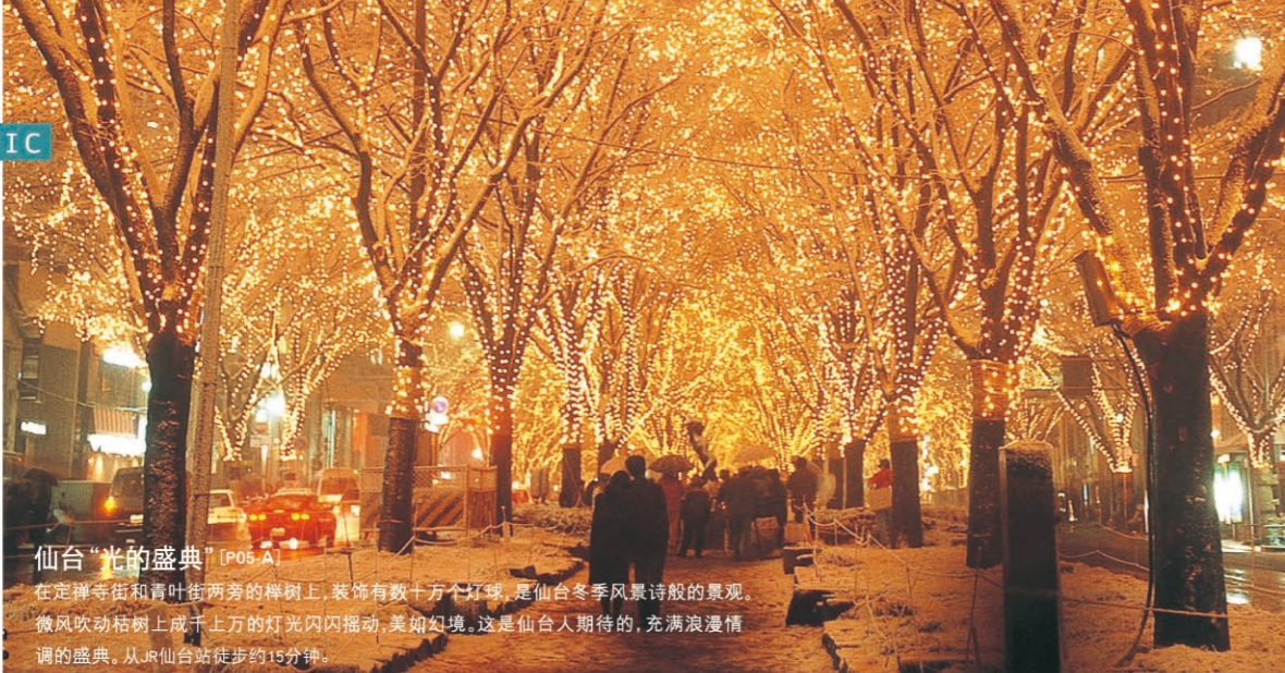
仙台“光的盛典” [P05-A] 在定禅寺街和青叶街两旁的榉树上,装饰有数十万个灯饰,是仙台冬季风景诗般的景观。微风吹动枯树上成千上万的灯光闪闪晃动,美如幻境。这是仙台人期待的,充满浪漫情调的盛典。从JR仙台站徒步约15分钟。

拥有“森林之城”的美誉, 人口约100万人的仙台市是宫城县的中心, 也是东北地区重要的政治、经济中枢都市。 摩天大厦,百货店,写字楼等新建筑和商店陆续落成, 雅致的街景,洗练的都市氛围,令人留恋。 向您介绍潇洒的仙台都市风情。